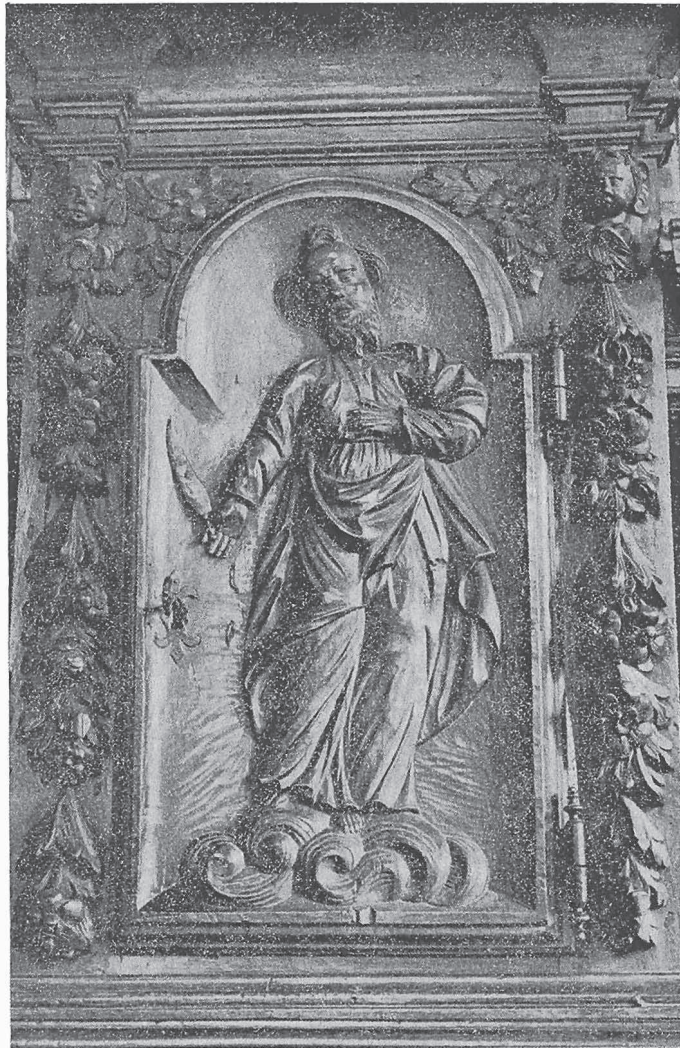
MEZZANA: Particolare dell'armadietto centrale del credenzone della sacrestia, scolpito da legnamari biellesi alla fine del sec. XVII - inizio del sec. XVIII

beo et in calice indecentissimo cum tribus particulis cum velo serico supra posito... et prope dictum sacramentum aderat lampas accensa.