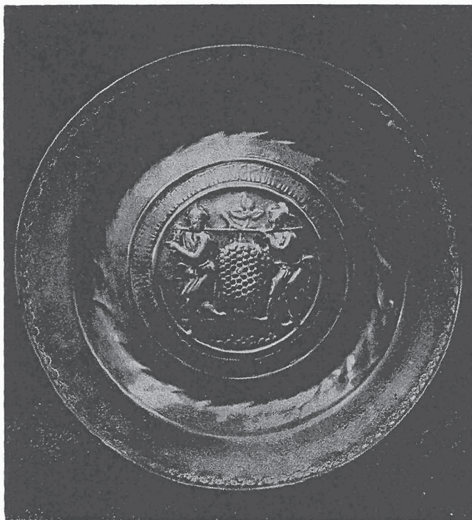
MEZZANA: Bacile per le offerte di ottone con iscrizione a caratteri gotici e con la raffigurazione del ritorno dei messaggeri dalla terra promessa (sec. XVII)

La parrocchia di Mezzana conserva numerosi paramenti di broccato, tra cui ricordiamo un paramentale rosso broccato in oro del sec. XVIII, un altro paramentale rosso broccato in oro e argento dello stesso secolo, una pianeta rossa broccato in argento del sec. XVII, tre pianete bianche broccato oro e argento del sec. XVIII, un paramentale ricamato in seta e oro dell'inizio del secolo scorso (i paramentali hanno tutti le tunicelle, ma mancano del piviale) e altre pianete di minor valore. Tra le argenterie, ricordiamo un calice d'argento, lavorato a cesello, di notevole altezza, della seconda metà del sec. XVIII e un pregevolissimo ostensorio a campana d'ar-