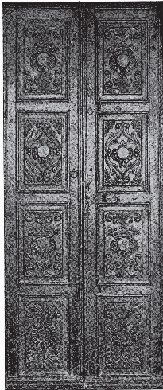
MEZZANA: Porta della sacrestia a pannelli scolpiti, lavoro di legnamari biellesi della fine del sec. XVIII

Obturentur lapides Sepulcrales ne fetor redoleat... (75).