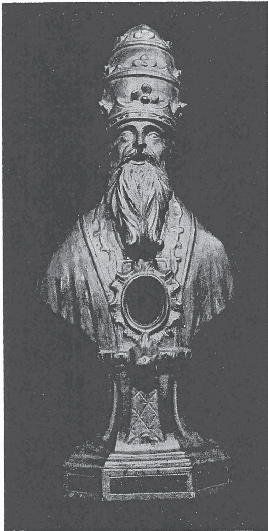
MEZZANA: Busto reliquiario di legno dorato della fine del sec. XVIII, attribuibile allo scultore Pietro Antonio Serpentiere di Sagliano

loco humili..., jn quo non as-servatur... Altare ad prescrip-tum et est ornatum et provi-sum de necessarijs ad celebra-tionem... Lampas continuo ardet ex elemosinis Eccl.ie... Jn cornu Evangelij Altare sub tit.° B.V.M. jn quo est erecta Confraternitas Suffragij mor-tuorum, habet necessaria pro sacro faciendo... Altare sub tit.° S.ti Antonij de Padua suspenditur donec redducatur ad prescriptum quamvis habeat necessaria ad celebrationem, desunt cancelli.