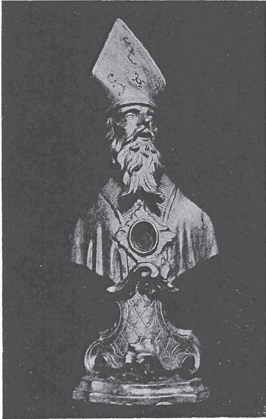
MEZZANA: Busto reliquiario di legno dorato della fine del sec. XVIII, attribuibile allo scultore Pietro Antonio Serpentiere di Sagliano