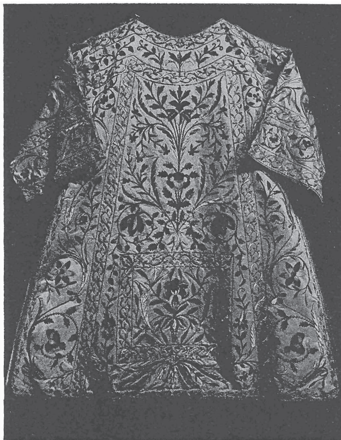
MEZZANA: Tunica del paramentale bianco ricamato in seta e oro dell'inizio del sec. XIX

gento della stessa epoca, un raggio grande d'argento cesellato, eseguito nel 1836 dall'orefice G. B. Pezzi di Alessandria, un ostensorio a campana di metallo della fine del sec. XVI e un altro calice d'argento cesellato della stessa epoca. Degno pure di menzione un grande piatto di ottone per le offerte con scritta in caratteri gotici e con raffigurato nel centro il ritorno dei messaggeri dalla terra promessa (sec. XVII). Ricordiamo inoltre una pisside del sec. XVII, un piccolo reliquiario per la reliquia di S. Bartolomeo in lamina d'argento del sec. XVIII e altri due di legno dorato della stessa epoca; quattro busti-reliquiari di legno dorato raffiguranti due Santi Papi e due Vescovi, attribuibili allo scalpello di Pietro Antonio Serpentiere; diversi candelieri di legno dorato della seconda metà del sec. XVIII; un turibolo con navicella di rame argentato in stile Impero; una navicella di rame argentato col piede di ottone operato del sec. XVII; e gli attuali candelieri di rame argentato del secolo scorso, acquistati dalla parrocchia di Santhià.