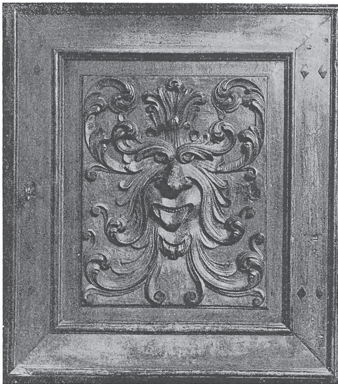
MEZZANA: Particolare delle ante inferiori del credenzione della sacrestia, scolpito da legnamari biellesi alla fine del sec. XVII - inizio del sec. XVIII

A sinistris altaris predicti reperiuntur novem Cerei sustentati lignis et circum circa fornicem sunt picture mensium in forma hominum indecentes que veniunt delende et circum quaque capellam adsunt sedilia lignea et ex lateribus. Demum Capella clauditur muro lateritio altitudinis brachiorum duorum et penes d. fornicem adest alius Crucifixus super quodam ligno pendens.