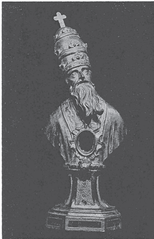
MEZZANA: Busto reliquiario di legno dorato della fine del sec. XVIII, attribuibile allo scultore Pietro Antonio Serpentiere di Sagliano