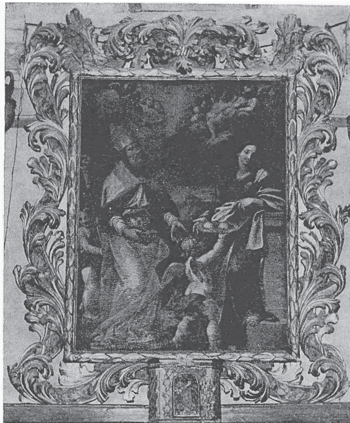
MEZZANA: Tela dell'altare di San Grato e di S. Agata di buon pennello del sec. XVIII racchiusa in pregevole cornice di legno dorato