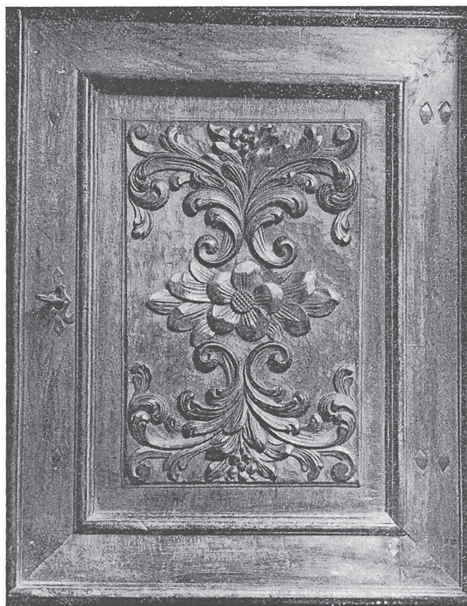
MEZZANA: Particolare delle ante inferiori del credenzione della sacrestia, scolpito da legnamari biellesi alla fine del sec. XVII - inizio del sec. XVIII

In ingressum maioris porte in angulo a dextris illius adest pulpitus ligneus mobilis pro concionantibus. Extra Capellam predictam adest Sacri-