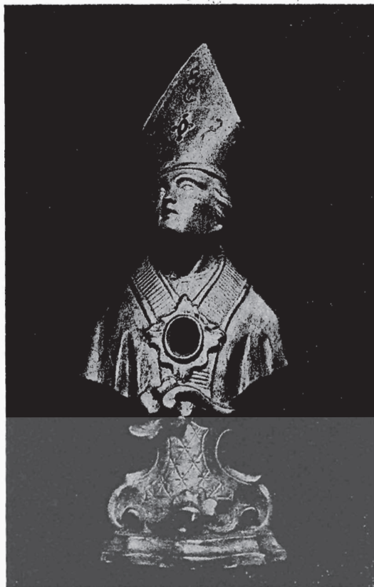
MEZZANA: Busto reliquiario di legno dorato della fine del sec. XVIII, attribuibile allo scultore Pietro Antonio Serpentiere di Sagliano