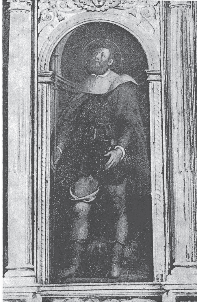
MEZZANA: S. Rocco dipinto sull'ancora di legno dorato e dipinto dell'altare maggiore (scuola vercellese degli ultimi decenni del sec. XVI)