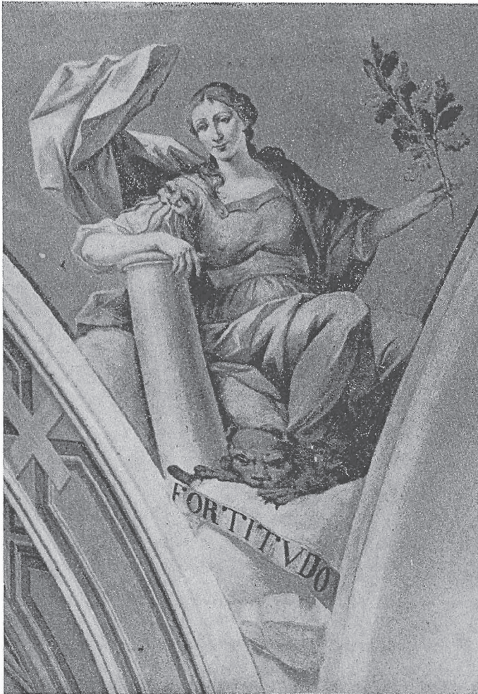
MEZZANA: Dipinto della volta del presbitero raffigurante la Fortezza, eseguito dal pittore Giovanni Antonio Orgiazzi di Varallo nel 1766

Biella il 22 dicembre dello stesso anno (58) . Il cit. elenco attesta che « prese possesso a 25 Xbre giorno di Natale » (38) .