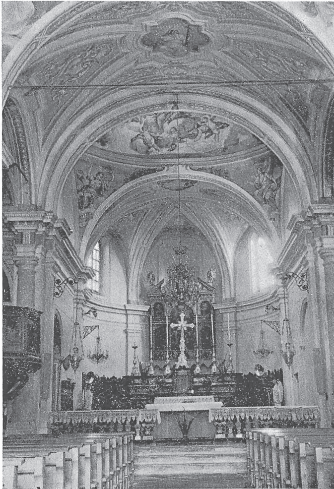
MEZZANA: Interno della chiesa parrocchiale riedificata nel sec. XVII e ampliata nel coro nel 1765