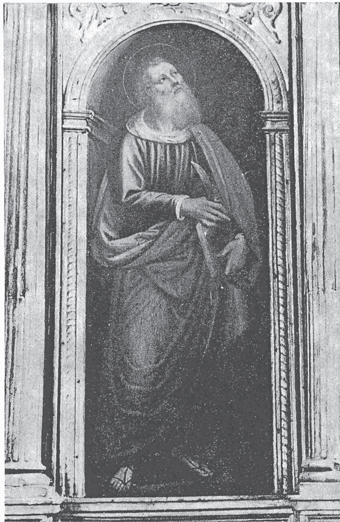
MEZZANA: S. Bartolomeo, patrono della parrocchia, dipinto sull'ancona dell'altare maggiore (scuola vercellese degli ultimi decenni del sec. XVI).