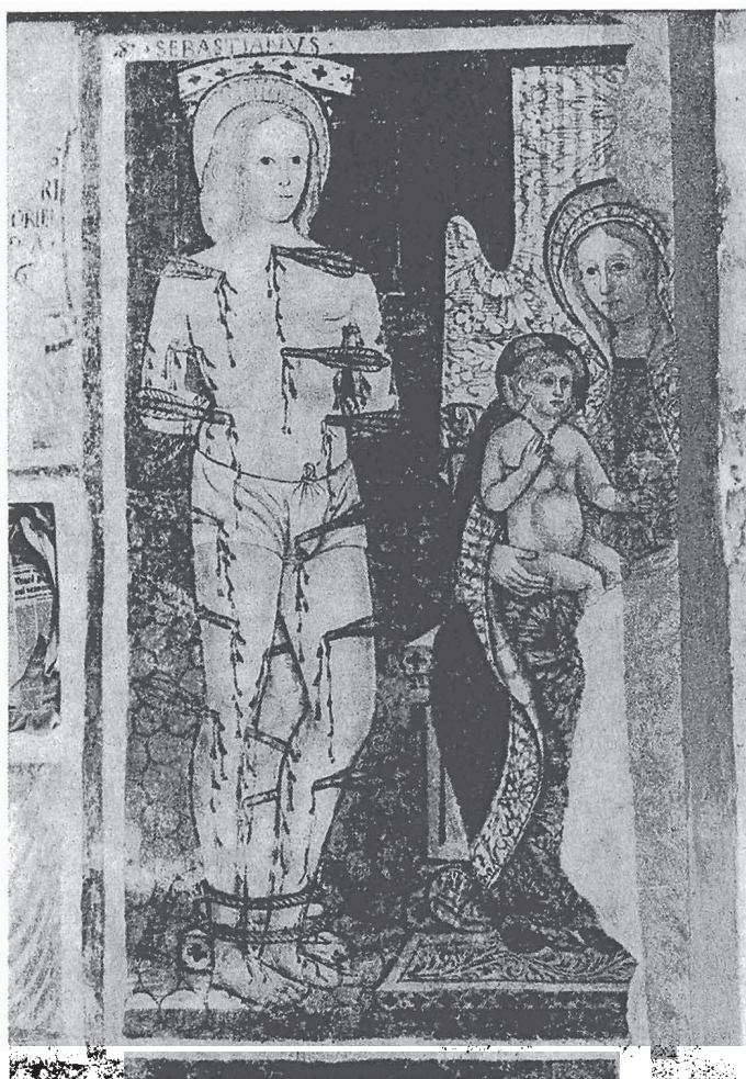
MEZZANA: Particolare degli affreschi della parete destra dell'oratorio di S. Rocco di Montealto raffiguranti S. Sebastiano e la Madonna in trono col Bambino, di scuola novarese dei primi decenni del sec. XVI