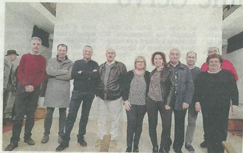
Un momento della passata edizione

In occasione dei vent'anni di attività sono previste anche alcune novità, è stata inserita la categoria "Fotografie su Mezzana" e la categoria Junior dedicata ai giovani. Sono 281 le fotografie che saranno esposte nei locali del cine-teatro Angelus di Mezzana. Sabato apertura alle 15 fino alle 19. Poi la rassegna sarà aperta anche il 27 novembre e nelle giornate dell'1, 2 e 3 novembre sempre con gli stessi orari. La premiazione è fissata domenica 3 novembre alle 17.