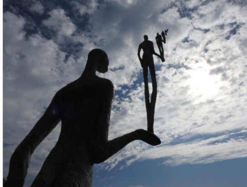
“Ad un passo dal cielo”, la foto più votata dal pubblico - Foto concorso “Parrocchia di Mezzana”