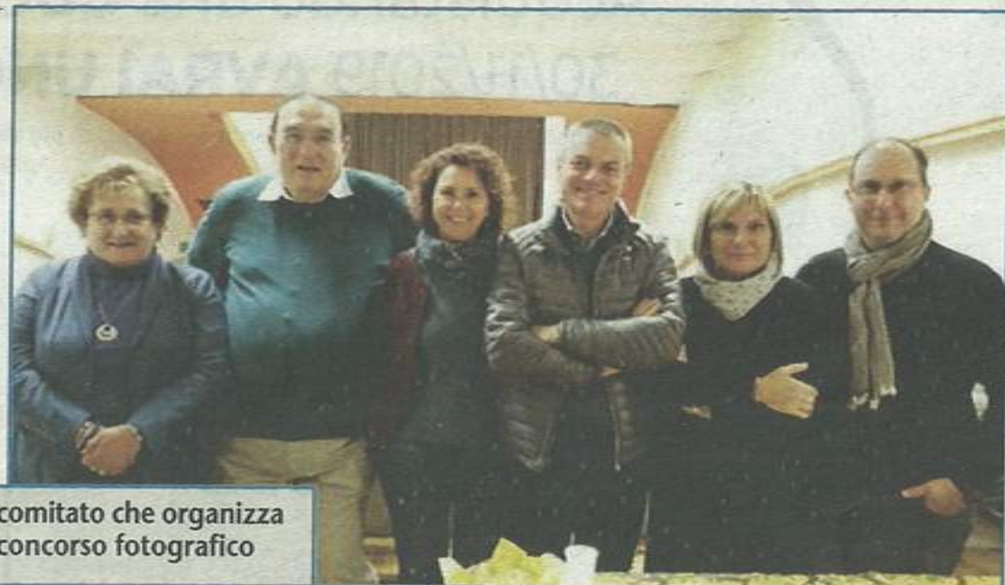
Il comitato che organizza il concorso fotografico

In occasione della 20ª edizione sono state istituite due nuove categorie: una è dedicata ai giovani