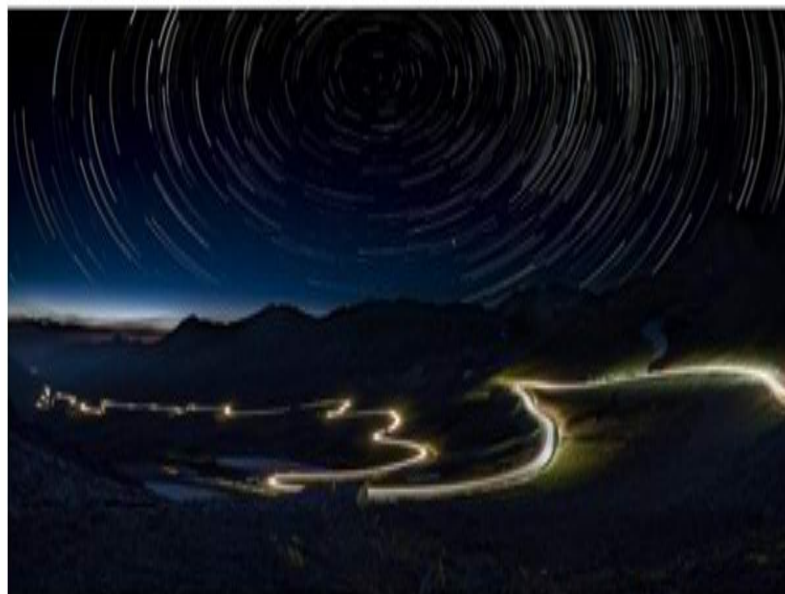
La fotografia vincitrice della scorsa edizione - Foto di repertorio

Sabato 26 ottobre il via alla manifestazione con 73 concorrenti provenienti da tutta Italia