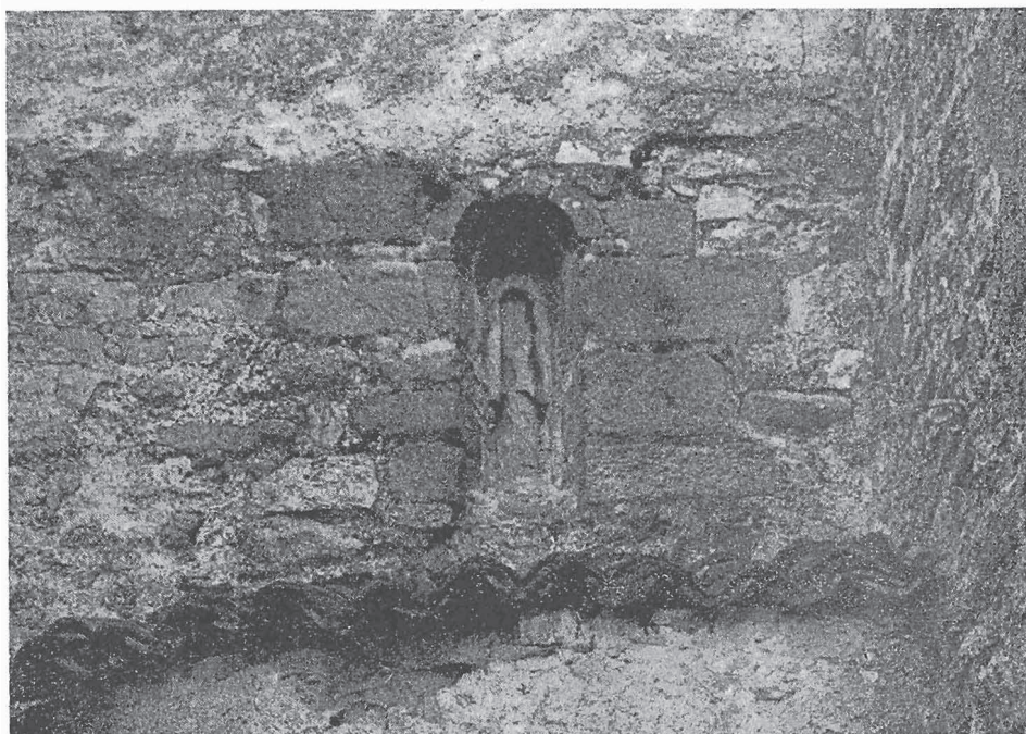
MEZZANA: Resti della chiesa romanica con feritoia in pietra squadrata incorporati nella costruzione della parrocchiale attuale (sec. XII)

Di questa situazione ne aveva approfittato il marchese Francesco Giuseppe Wilcardel de Fleury, la cui famiglia nel 1619 aveva ottenuto i marchesati di Trivero e di Mortigliengo. Costui, in cambio della cessione da parte della chiesa della casa parrocchiale al fine di ampliare il vicino palazzo, che allora stava costruendo, nel 1659 fece una nuova dotazione alla parrocchia, riservando alla propria famiglia il diritto di patronato (12). Si stipularono i contratti, ma il patronato non fu mai esercitato, anche perchè poco dopo i Baglione furono reintegrati nei loro diritti. Alla vacanza della parrocchia nel 1681 i Baglione fecero causa contro la curia di Vercelli presso quella metropolitana di Milano e la vinsero. Furono sfortunati nella vacanza del 1705, perchè a causa delle guerre contro i francesi non riuscirono a